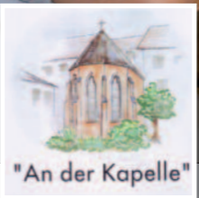
"An der Kapelle"