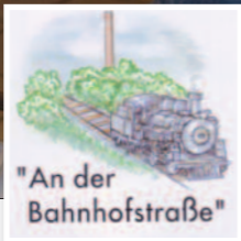
"An der Bahnhofstraße"